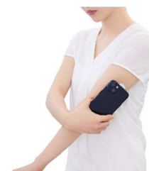
CGM（持続グルコース測定器）